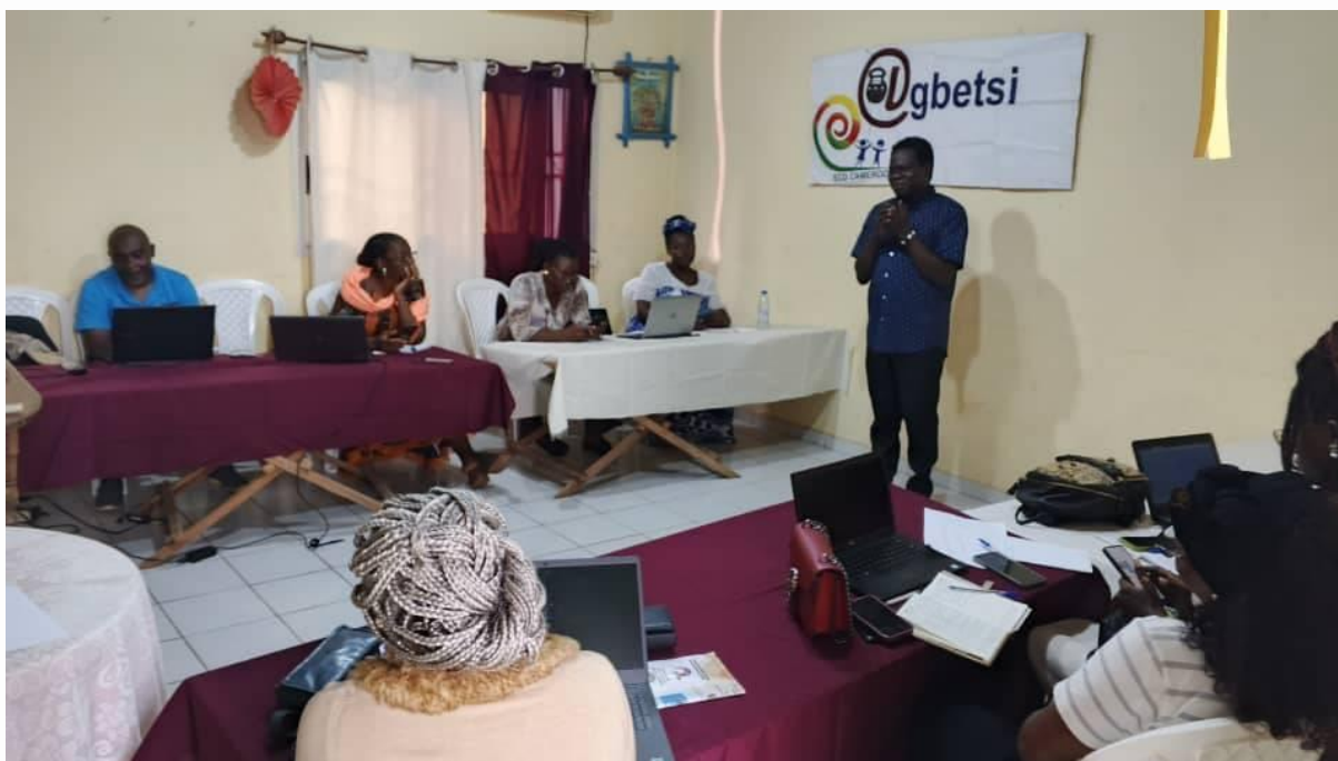
Séance de travail dans le cadre du projet : Formation sur la visibilité digitale

❖ L'insuffisance d'engagement associatif de certains membres : Les associations locales au Cameroun travaillent dans des conditions difficiles. Un bon nombre d'associations produit des résultats et de l'impact quantitatifs et qualitatifs. Les conditions difficiles de travail amènent certains membres à se décourager. Le découragement ne favorise pas l'engagement associatif. Il y a d'autres membres qui adhèrent à des associations pour espérer avoir des postes de commandement et de l'argent. Mais lorsqu'ils réalisent qu'un membre s'engage pour travailler, ils deviennent peu engagés.