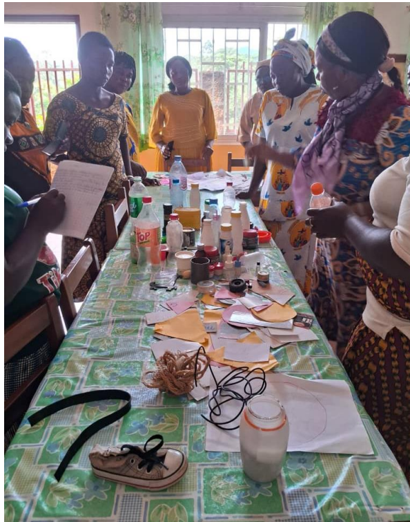
Atelier fabrication de matériel didactique lors de la formation des Monitrices Petite Enfance

iii-Redynamiser le Réseau : ECD Cameroon est redynamisé à travers ce grant. Tous les anciens membres ont été remobilisés par l'organisation des échanges en présentiel et en ligne. Certains ont participé à la rédaction des documents sous la supervision des spécialistes et d'autres ont pris une part active dans les comités de correction. Ces activités ponctuelles ont permis d'attirer de nouveaux membres. Le processus de redynamisation a aussi permis d'obtenir une formation des Monitrices Petite Enfance des Ecoles Maternelles des Sœurs de la Charité basée en République Centrafricaine. Une assemblée générale extraordinaire a été convoquée pour valider les documents clés. Une nouvelle page s'ouvre pour le Réseau et notre souhait c'est qu'elle soit une opportunité de changement et de progrès.