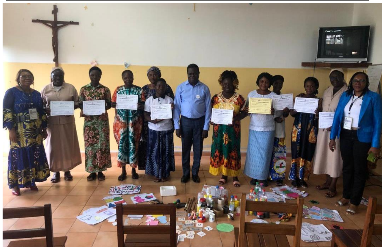
Formation des Monitrices Préscolaires Centrafricaines travaillant dans les Ecoles Maternelles des Sœurs de la Charité, à Yaoundé du 07 au 11 juillet 2025. Remise des Attestations de fin de formation