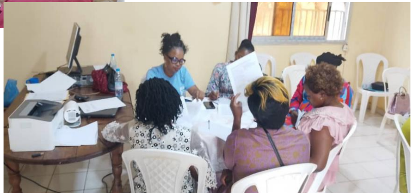
Travaux en groupe lors de l'Assemblée générale extraordinaire d'ECD Cameroon